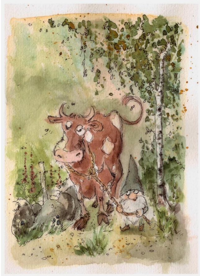
Tomten i Mellangården