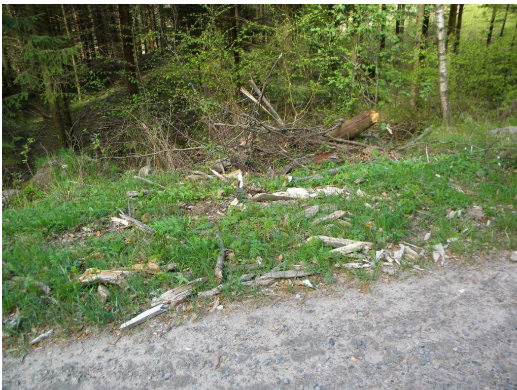
Småbitar efter den fallande tallen.